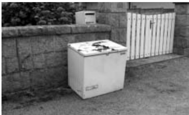
24 juin 2009, jour de marché...

► Les journées du Patrimoine sont cette année prévues le samedi 19 et dimanche 20 septembre.