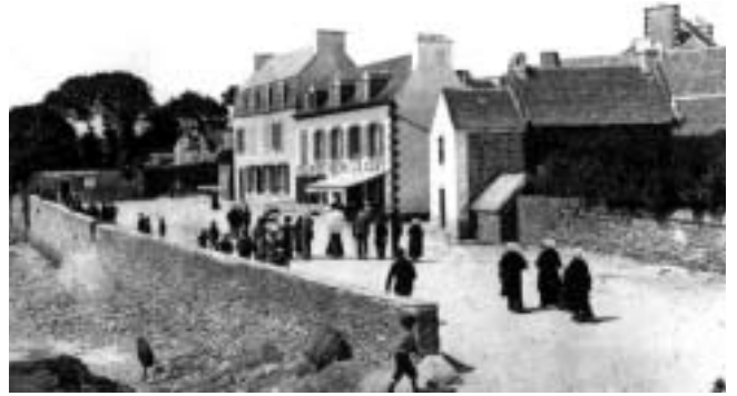
Guimaëc dans ce lieu-dit sur la route de Plouegat Guerrand.