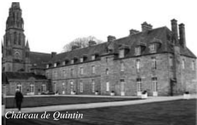
Château de Quintin

- Le jeudi 26 mars, sortie pour le château de Quintin et le musée de ses vases de nuits. L'après-midi fut consacrée à la visite du château et à son musée, superbes vases de nuit en faïence et porcelaine chinoise (Canton - XIX e siècle) et bourdaloues (Compagnie des Indes - XVIII e siècle) à usage et forme variés, en différentes matières (métal, grès, porcelaine, faïence, décorés aux pincesaux ou fabriqués en série dans des manufactures royales françaises, chinoises, anglaises, allemandes, hollandaises, italiennes ... Puis visite du superbe parc et de la cathédrale et retour vers Locquirec.